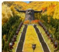
อุทยานเสินหลงเจีย