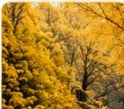
หุบเขาแปะก๊วย