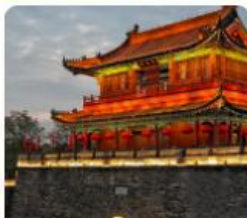
เมืองโบราณจิงโจว