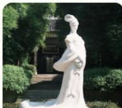
บ้านเกิดนางจ้าวจวิน

** รายการทัวร์อาจมีการเปลี่ยนแปลงตามความเหมาะสม โดยไม่ต้องแจ้งให้ทราบล่วงหน้า **