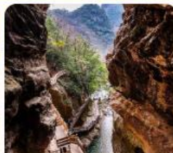
สะพานเทียนเซิง