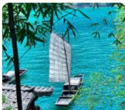
หมู่บ้านซานเซี่ย