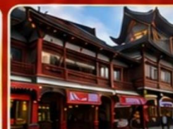
ถนนหวังฝูจิ่ง