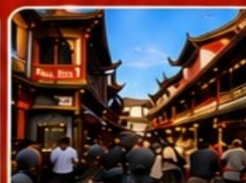
ตลาดร้อยปีเงินหวังเหมียว