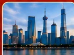
The North Bund Greenland