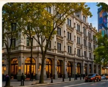
ถนน Anfu Lu